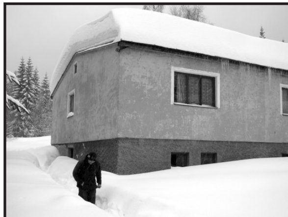
Rota Svárožná, Zimní tábor Stalker, rok 2006 a 2 metry sněhu.