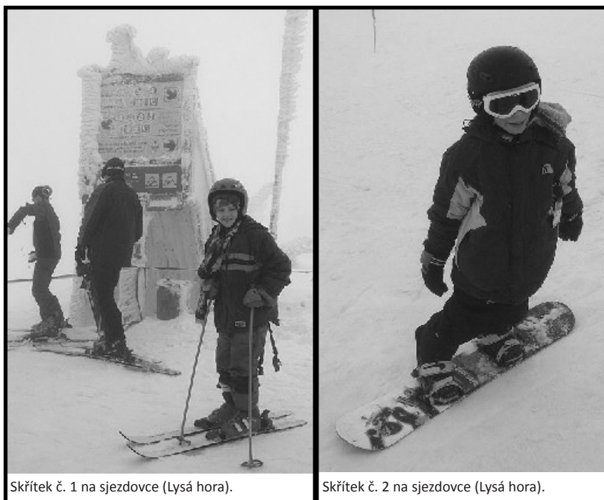
Skřítek č. 1 na sjezdovce (Lysá hora).