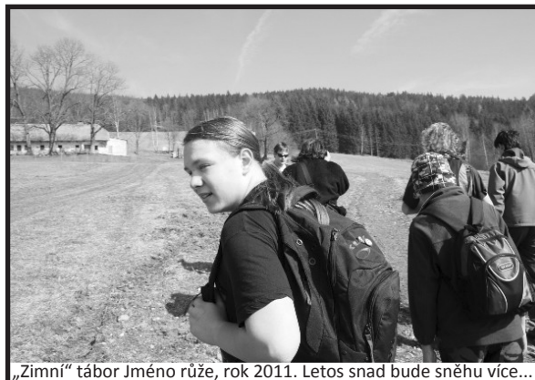
„Zimní“ tábor Jméno růže, rok 2011. Letos snad bude sněhu více...